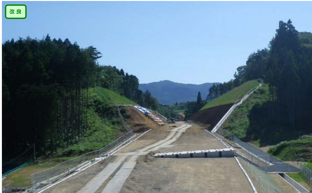
▲No.58から起点側を望む