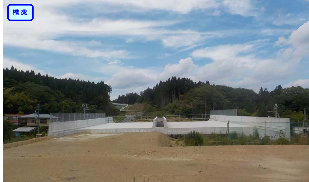
▲No.227から終点側を望む