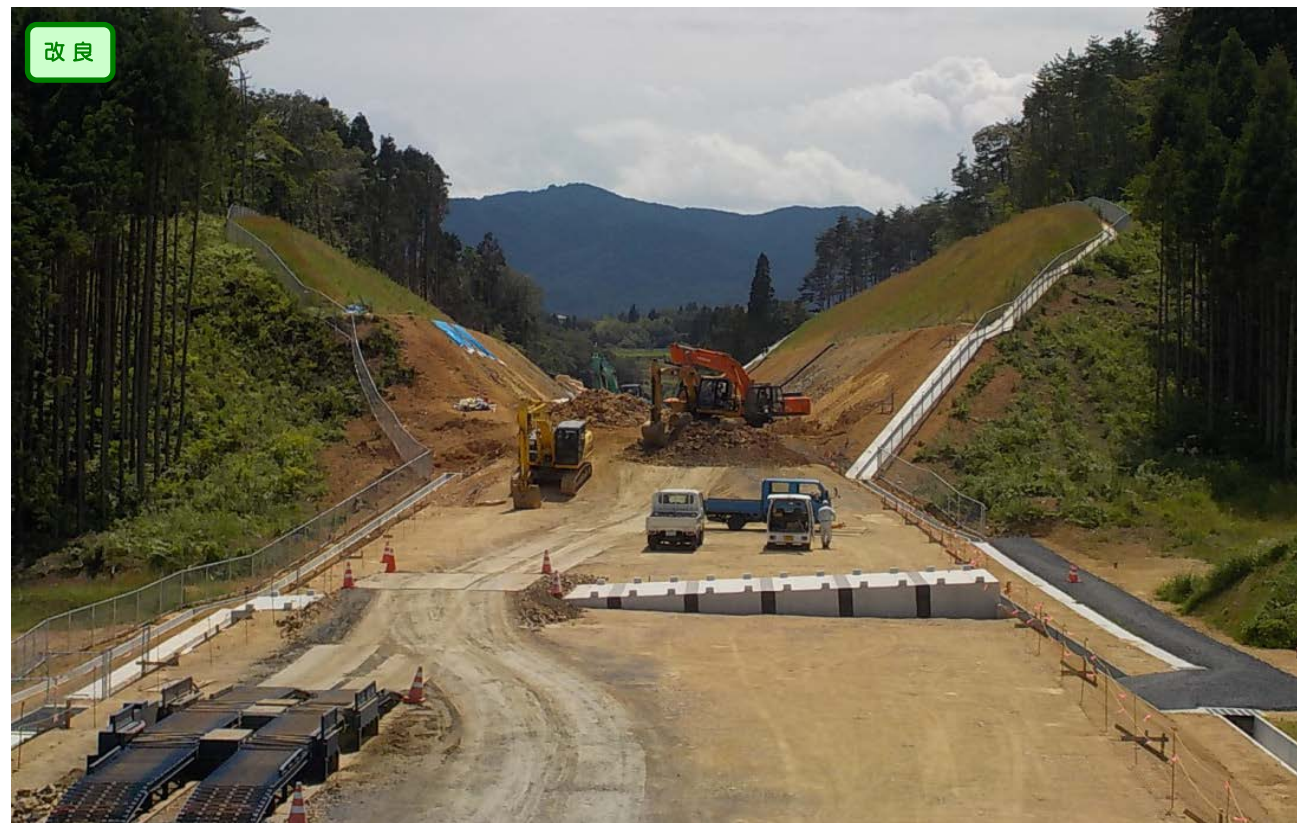
▲No.58から起点側を望む