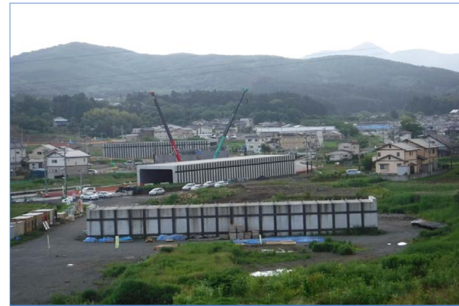
▲No.542より起点側を望む

面瀬地区道路改良工事 受注者：(株)新庄・鈴木・柴田組 工期：H28.4.1～H29.6.16