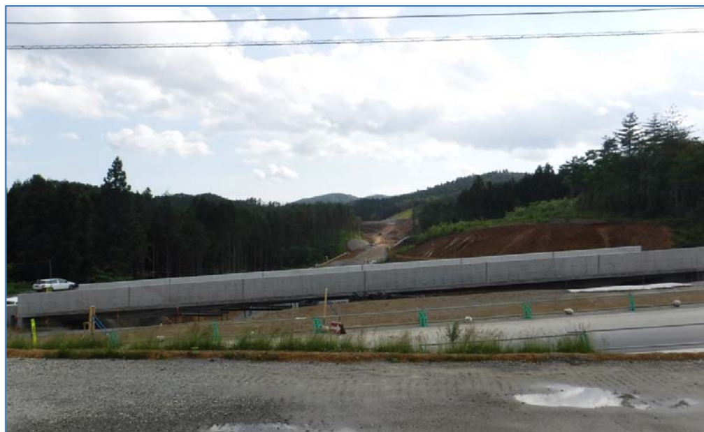
▲No.444より起点側を望む