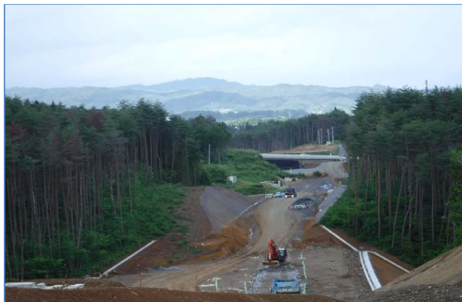
▲No.415より終点側を望む