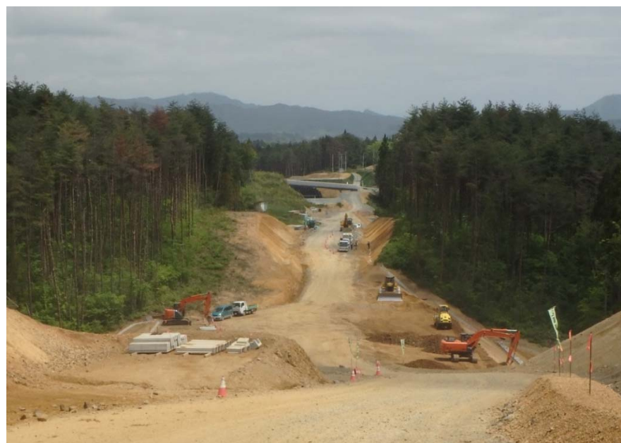
▲No.415より終点側を望む