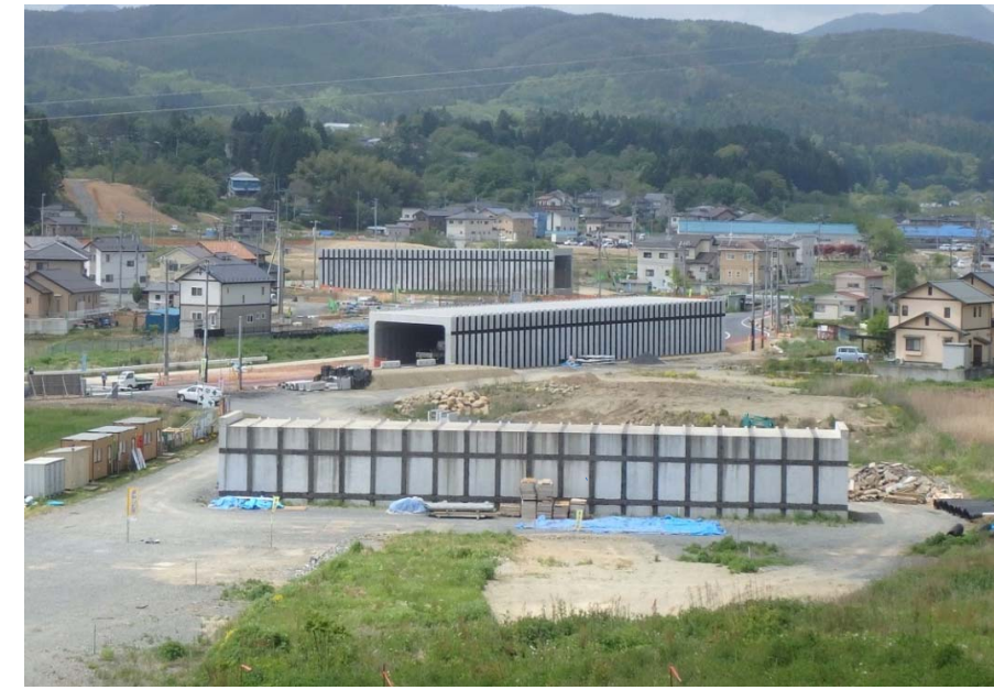
▲No.542より起点側を望む

面瀬地区道路改良工事 受注者：(株)新庄・鈴木・柴田組 工期：H28.4.1～H29.6.16