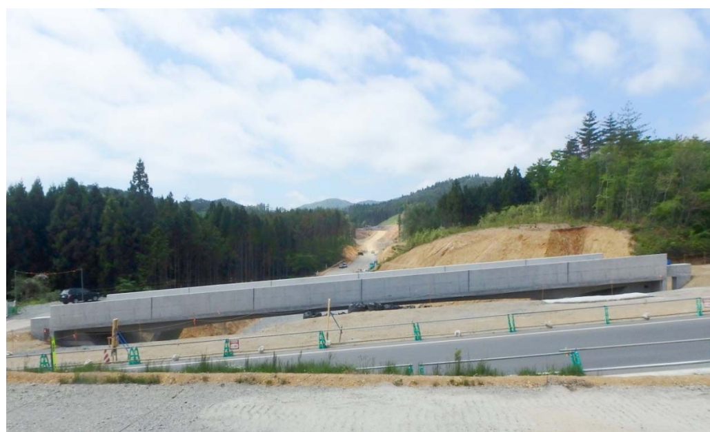
▲No.444より起点側を望む