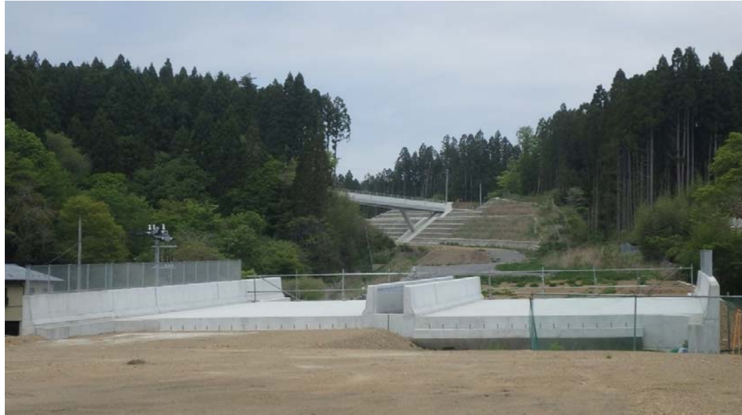
▲No.227から終点側を望む

大谷地区道路改良工事 受注者：(株)柿崎工務所 工期：H28.4.1～H29.10.20