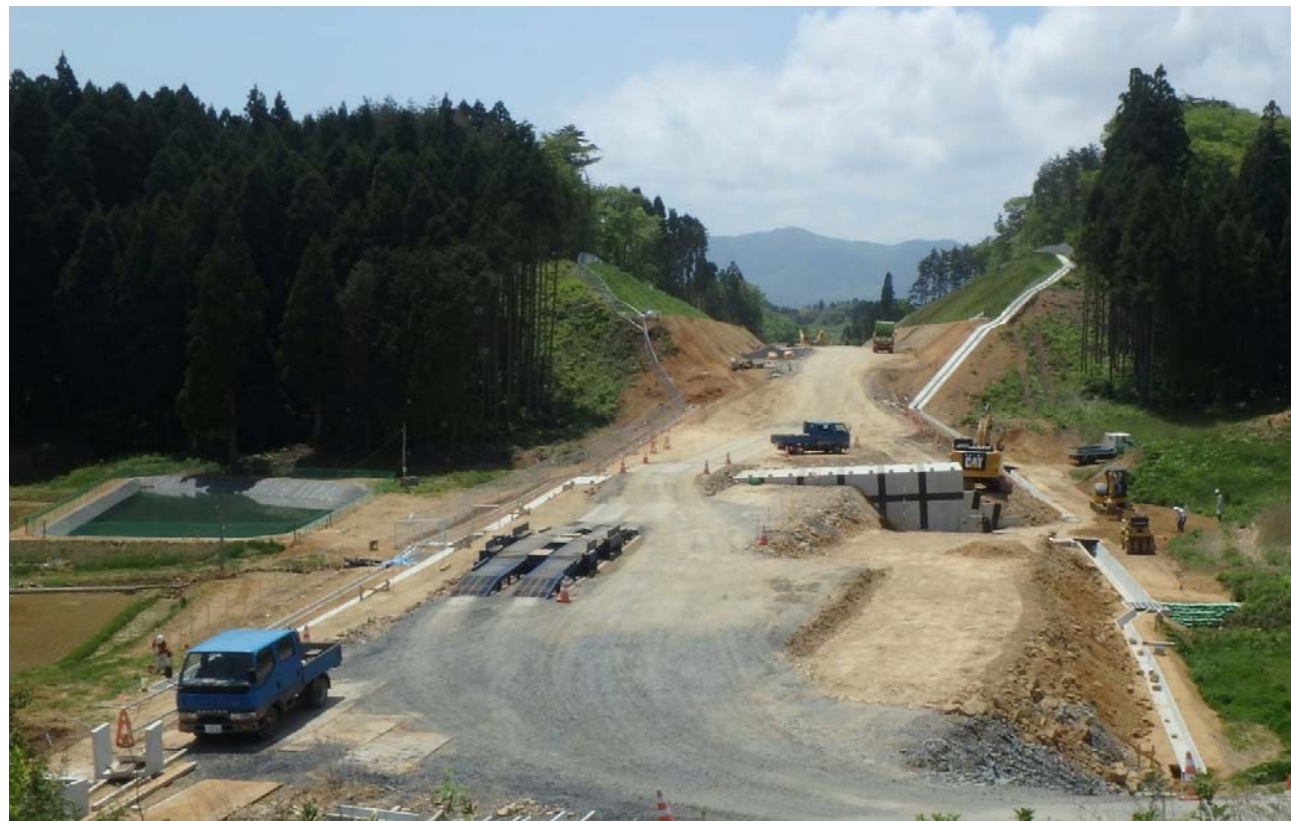
▲No.58から起点側を望む