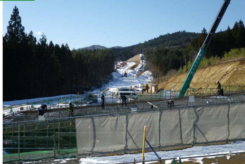
改良 ② No.443より起点側を望む