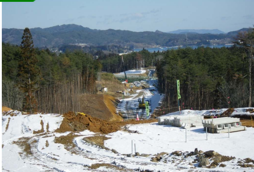
改良 ① No.415より終点側を望む