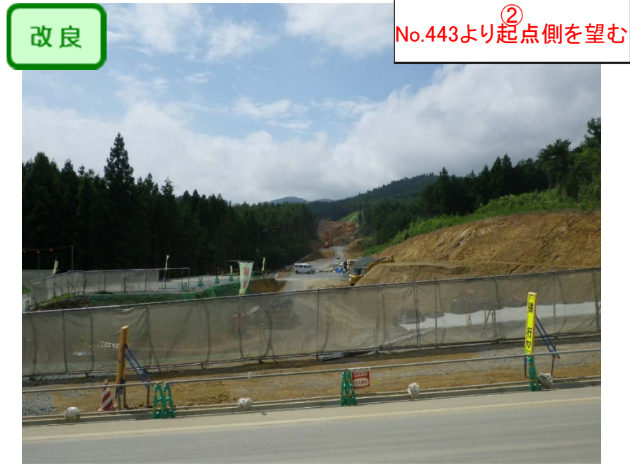
② No.443より起点側を望む