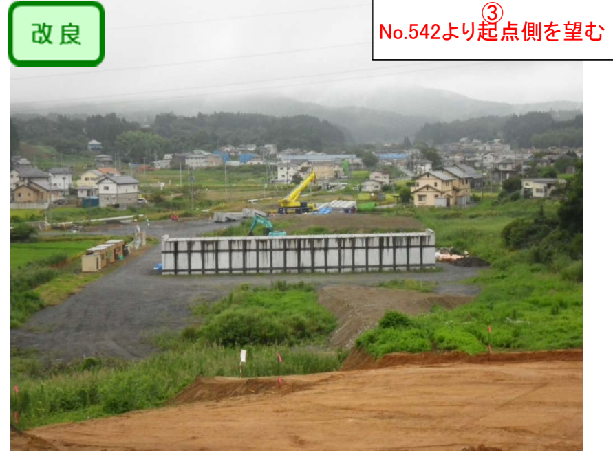
③ No.542より起点側を望む