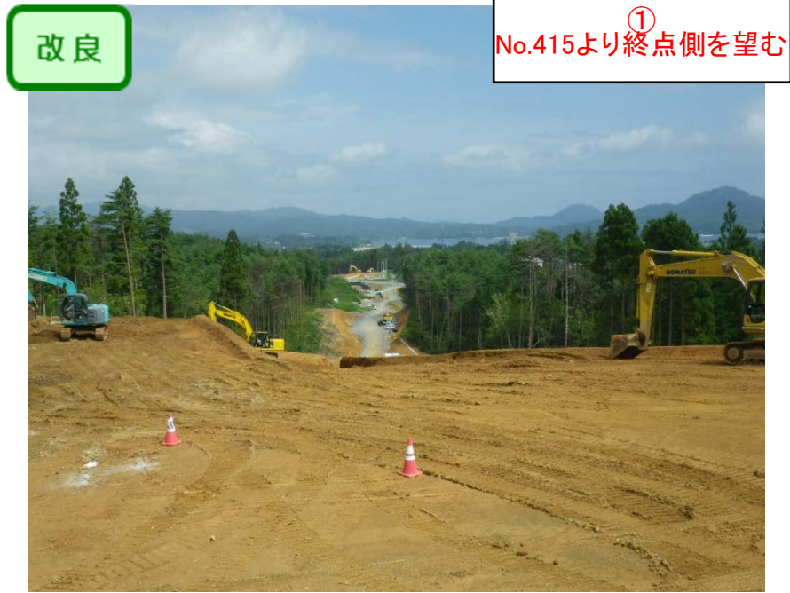
① No.415より終点側を望む