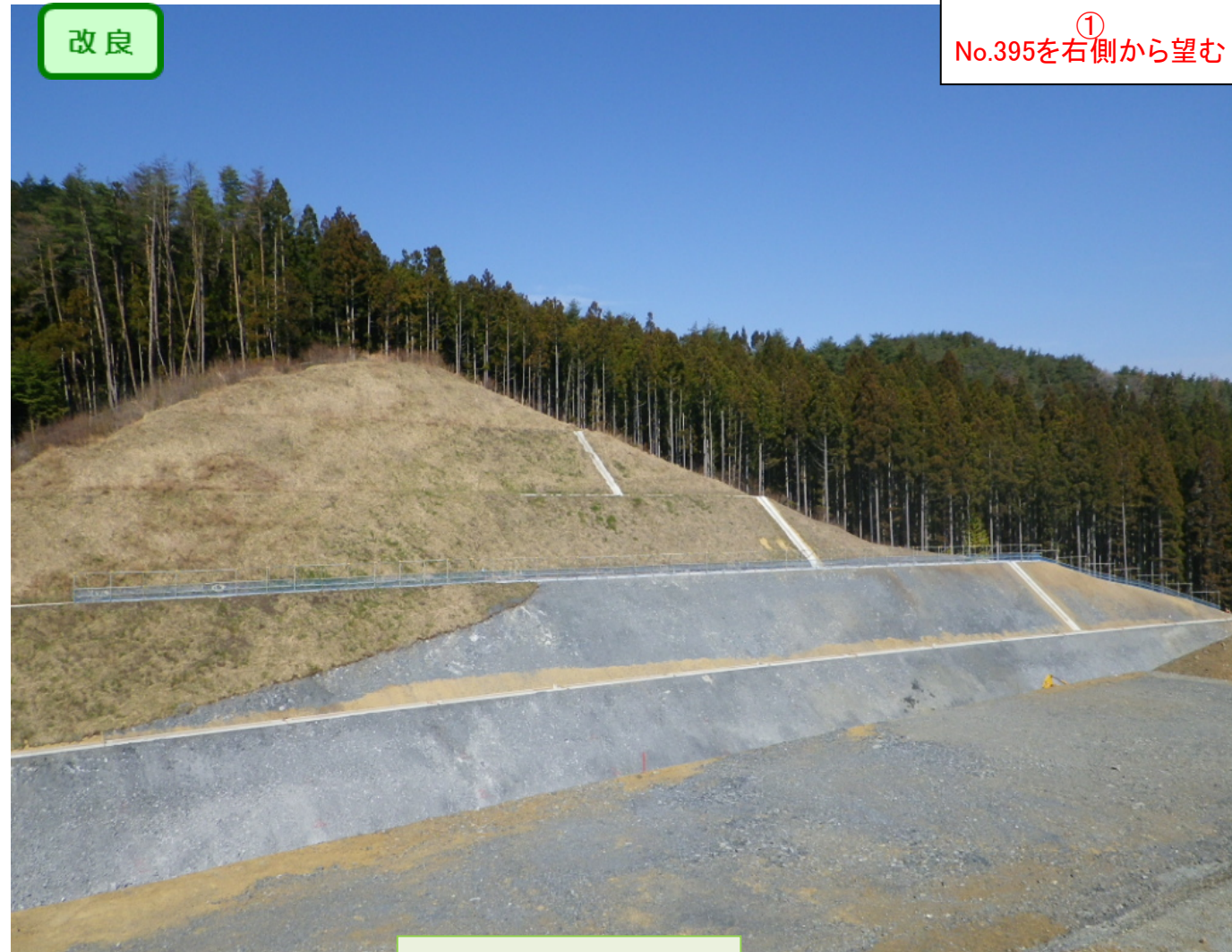
岩月・寺沢地区道路改良工事 受注者：(株)浅沼組 工期：H27.5.1～