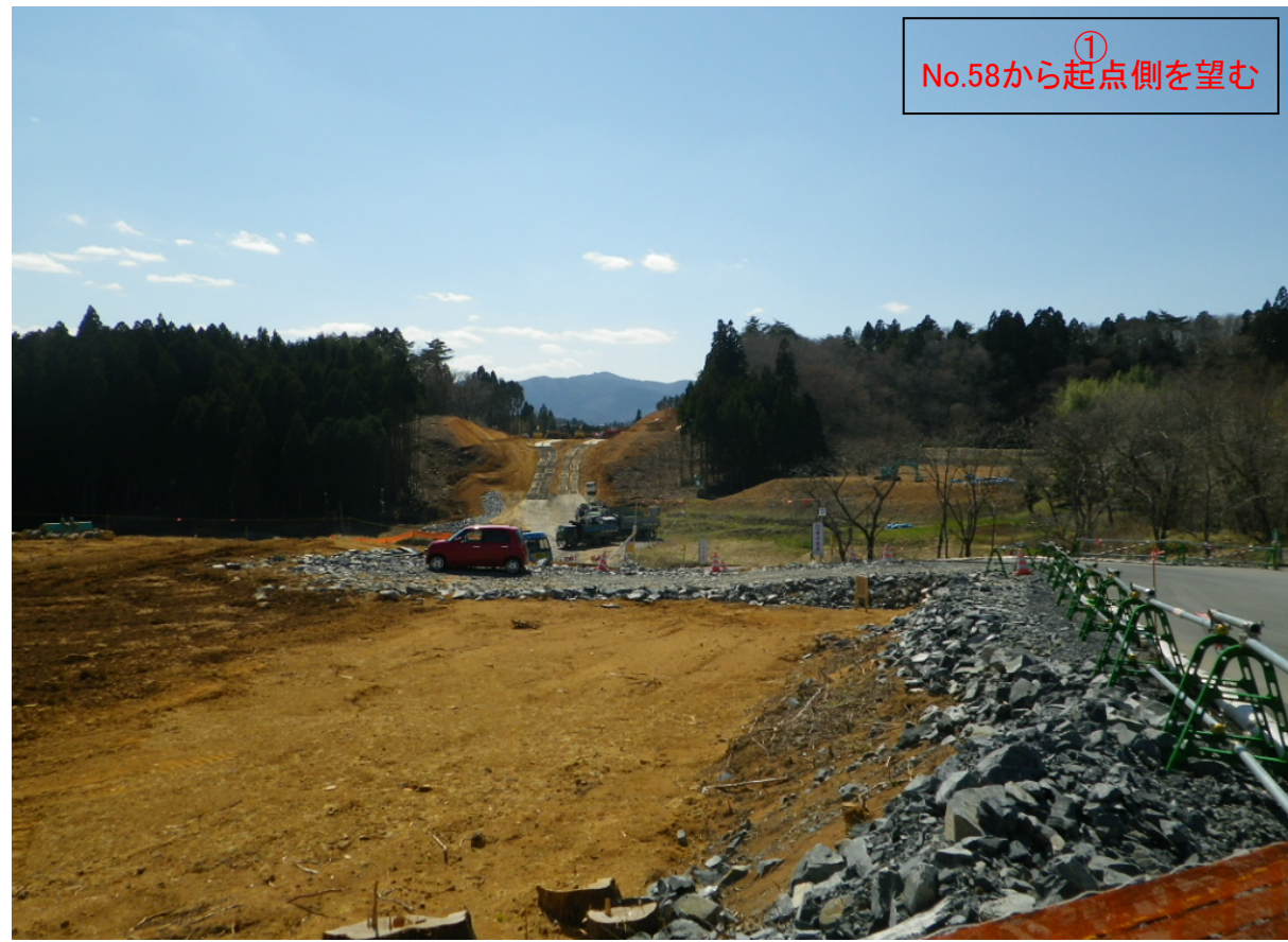
① No.58から起点側を望む