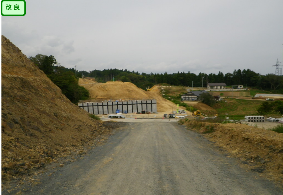
① No.215から終点側を望む