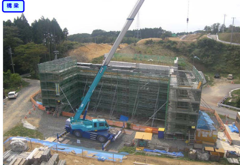
② No.233から起点側を望む