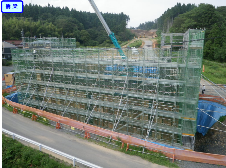
② No.228から終点側を望む