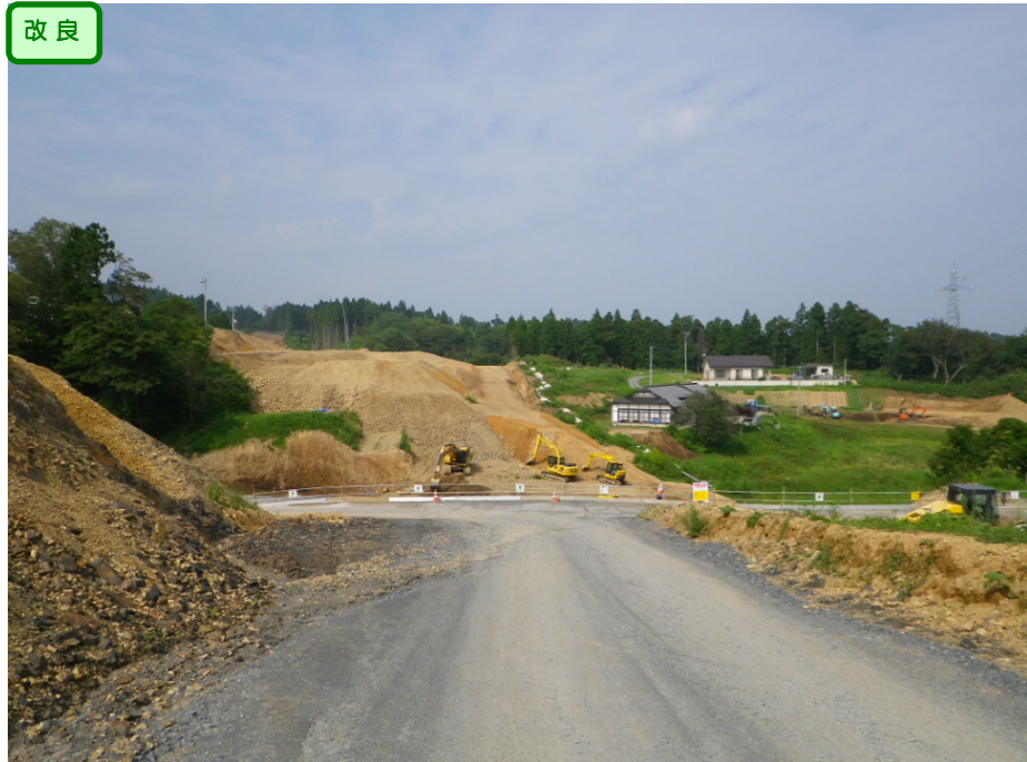
① No.215から終点側を望む