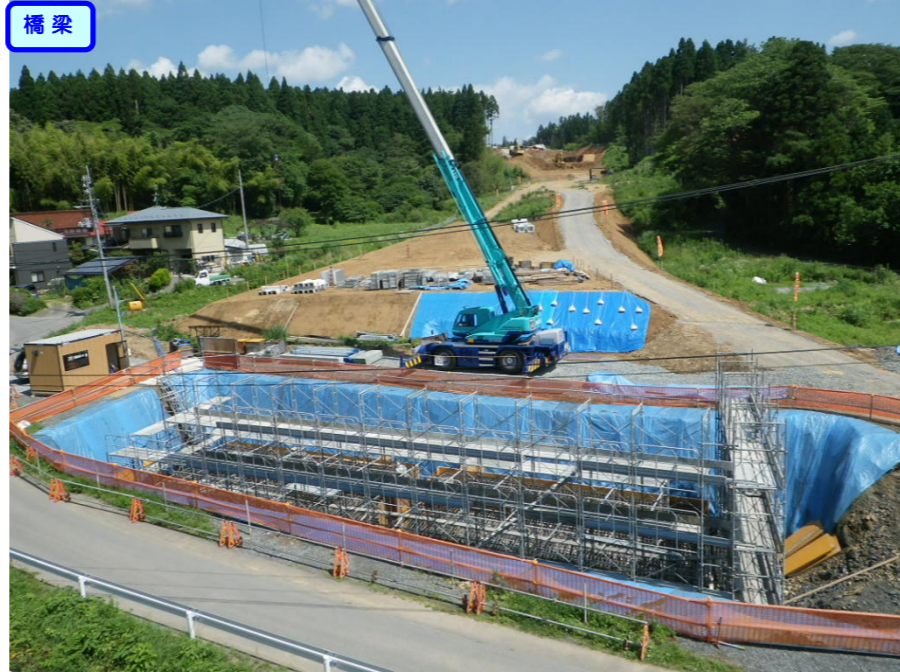
② No.228から終点側を望む