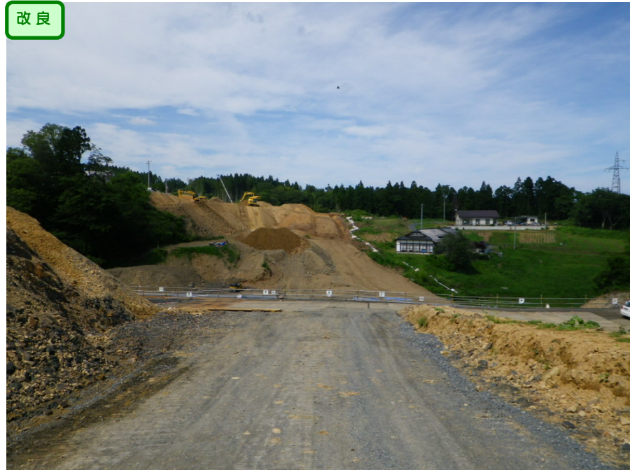
① No.215から終点側を望む