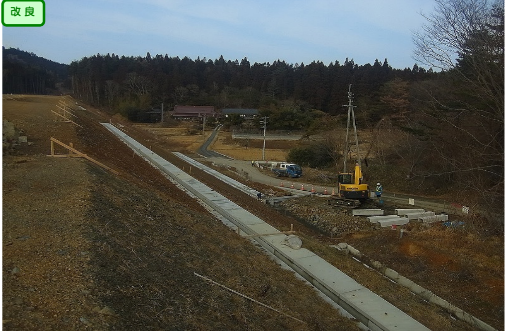
③ No.355から終点側を望む