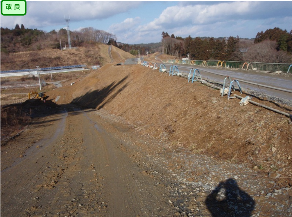
② No.300から終点側を望む