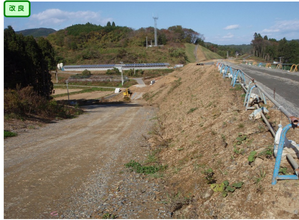
② No.300から終点側を望む