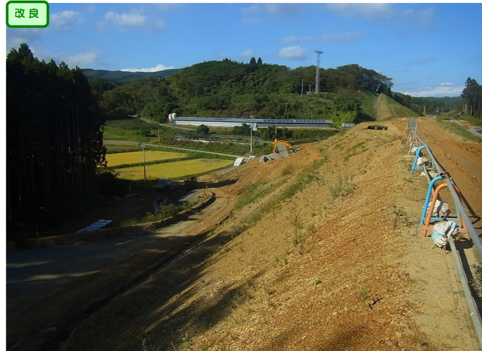
② No.300から終点側を望む