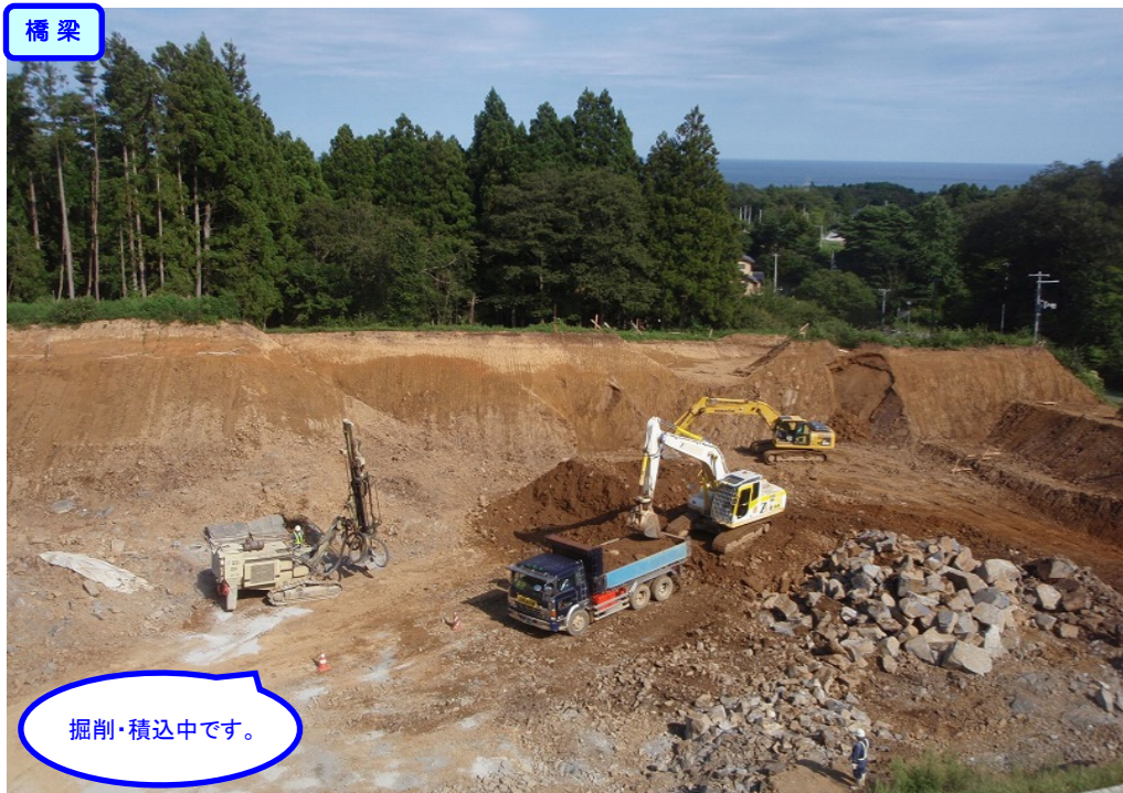
③ 縦貫道No.1から終点側を望む