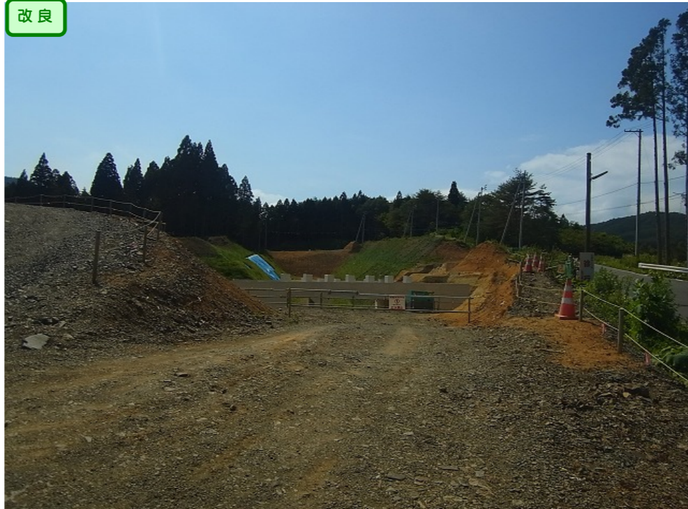
② 縦貫道No.14から起点側を望む