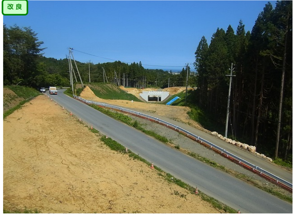
③ 縦貫道No.1から終点側を望む