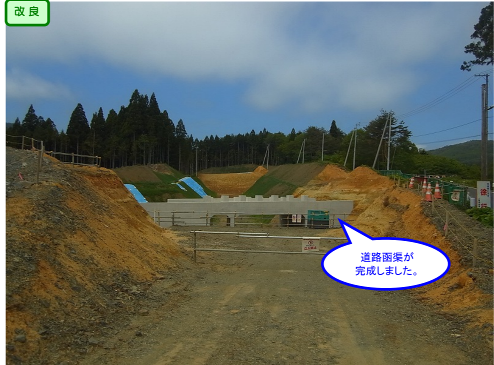
② 縦貫道No.14から起点側を望む