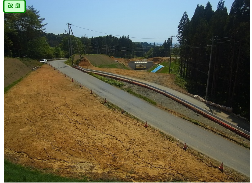
③ 縦貫道No.1から終点側を望む