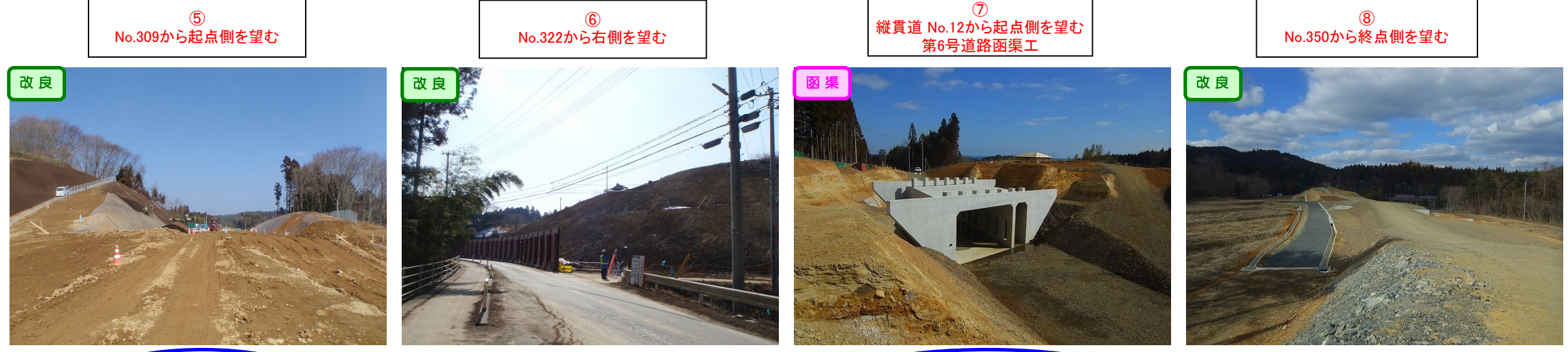
切土法面に植生基材吹付工を施工しています。