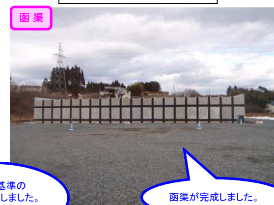
④ No.531から終点側を望む