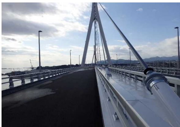
▲No.150付近から起点側を望む [気仙沼湾横断橋 P11～P12]