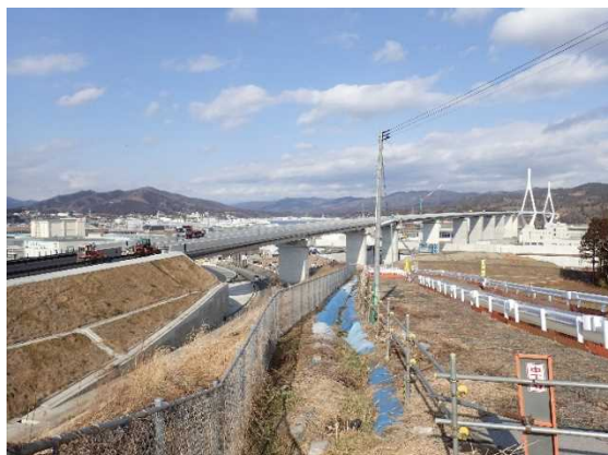
▲No.115付近から終点側を望む [気仙沼湾横断橋 P4～P11]