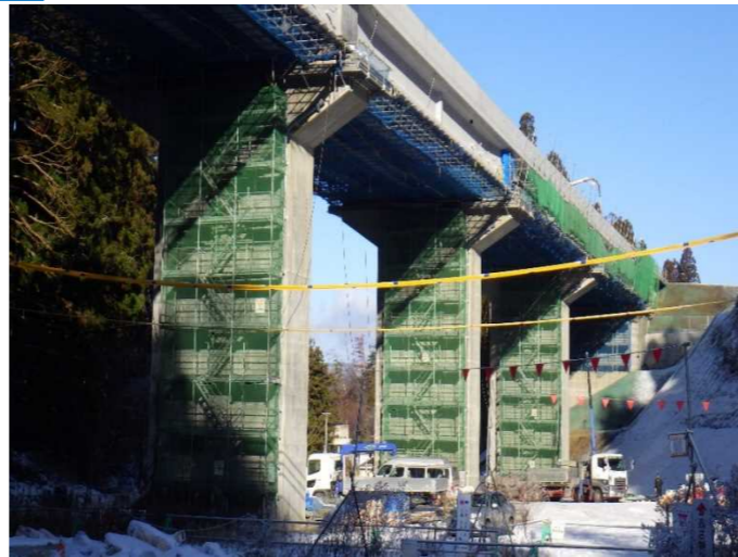
▲No.228から終点側を望む [浪板大橋(仮)]