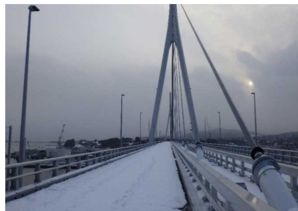
▲No.150付近から起点側を望む [気仙沼湾横断橋 P11～P12]