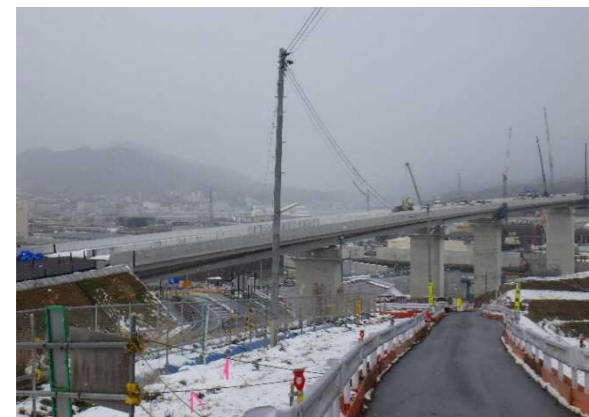
▲No.115付近から終点側を望む [気仙沼湾横断橋 P4～P11]