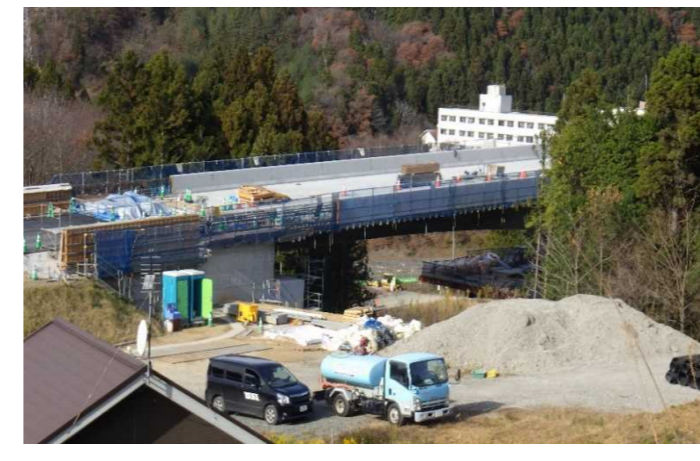
▲No285から終点側を望む [大峠山橋(仮)]