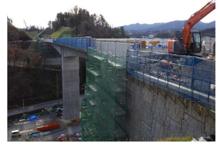
▲No271から終点側を望む [鹿折橋(仮)]