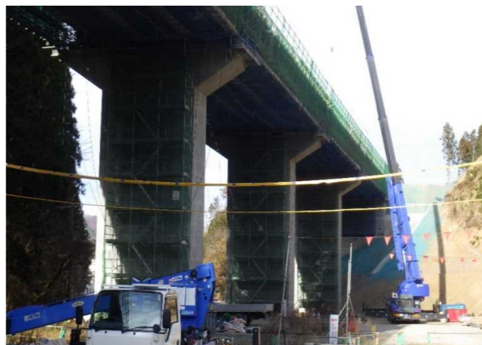
▲No.228から終点側を望む [浪板大橋(仮)]