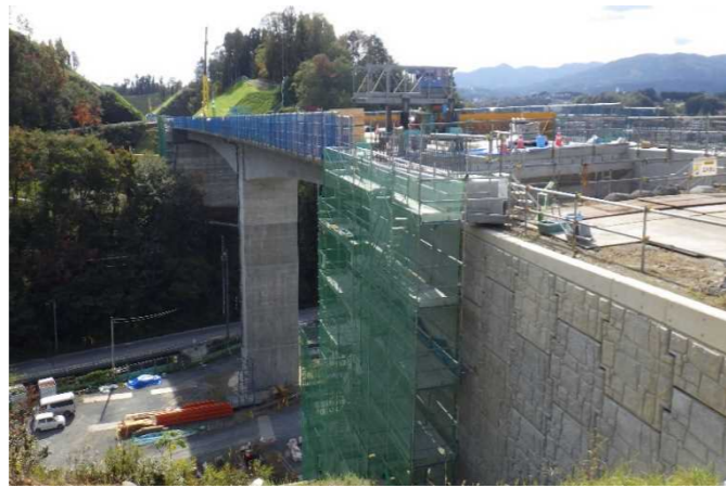
▲No271から終点側を望む [鹿折橋(仮)]