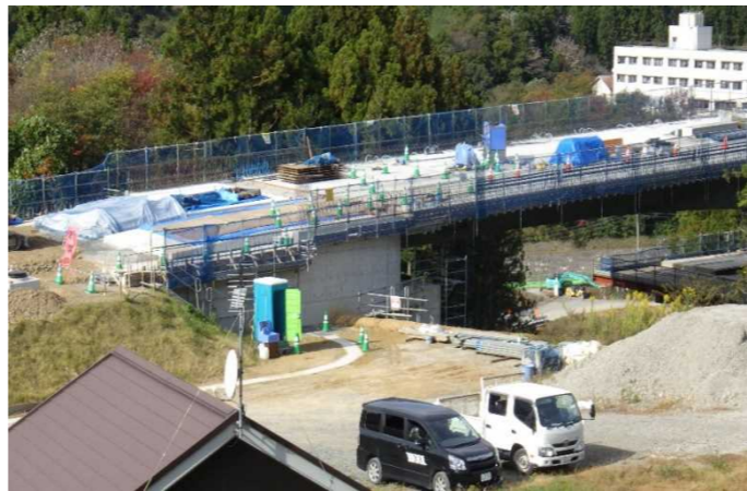
▲No285から終点側を望む [大峠山橋(仮)]