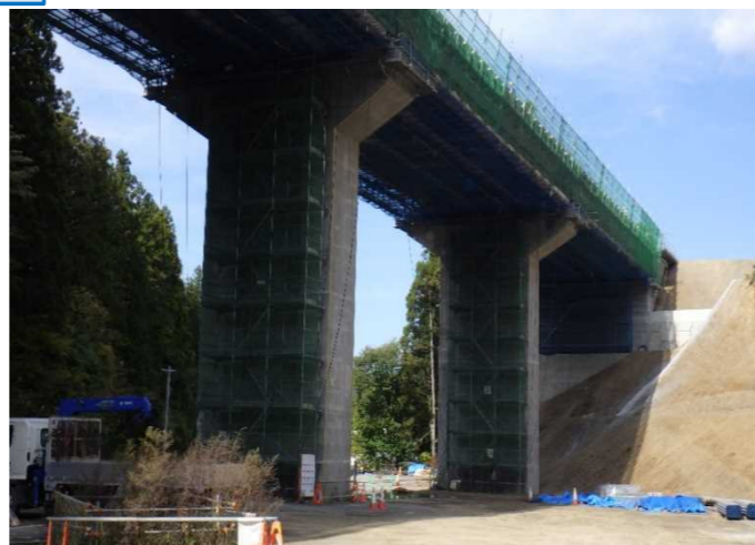
▲No.228から終点側を望む [浪板大橋(仮)]