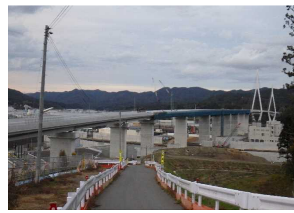
▲No.115付近から終点側を望む [気仙沼湾横断橋 P4～P11]