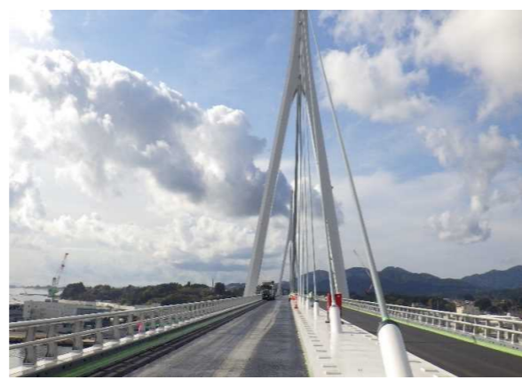
▲No.150付近から起点側を望む [気仙沼湾横断橋 P11～P12]