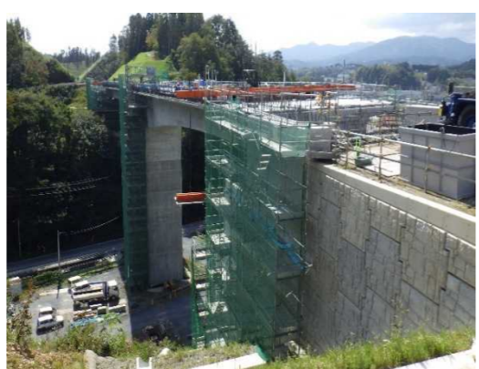
▲No271から終点側を望む [鹿折橋(仮)]