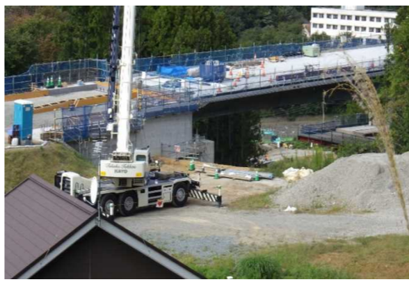
▲No285から終点側を望む [大峠山橋(仮)]