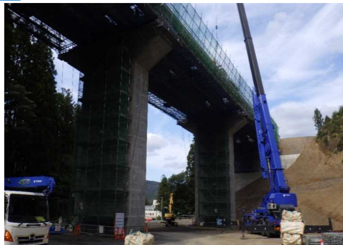
▲No.228から終点側を望む [浪板大橋(仮)]