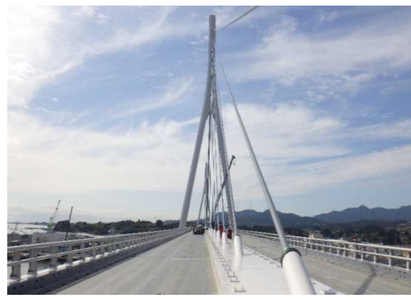
▲No.150付近から起点側を望む 〔(仮)気仙沼湾横断橋 P11～P12〕