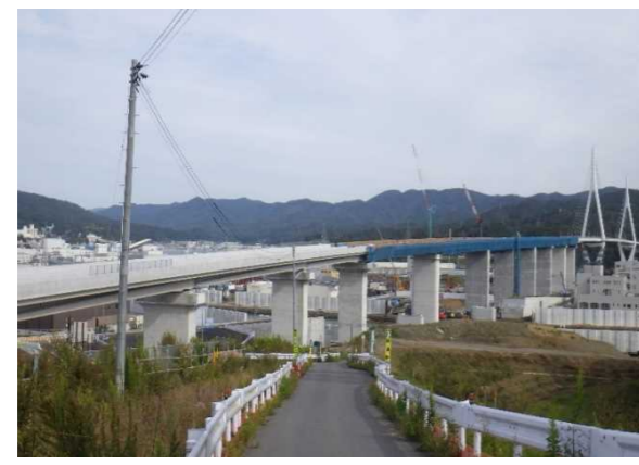
▲No.115付近から終点側を望む 〔(仮)気仙沼湾横断橋 P4～P11〕