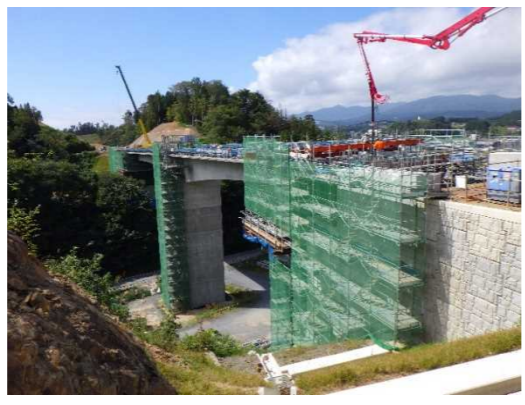
▲No271から終点側を望む [鹿折橋(仮)]