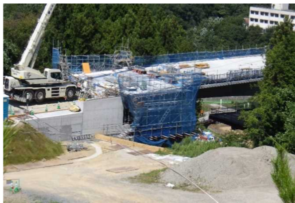
▲No285から終点側を望む [大峠山橋(仮)]