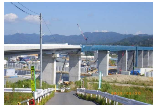
▲No.115付近から終点側を望む 〔(仮)気仙沼湾横断橋 P4～P11〕