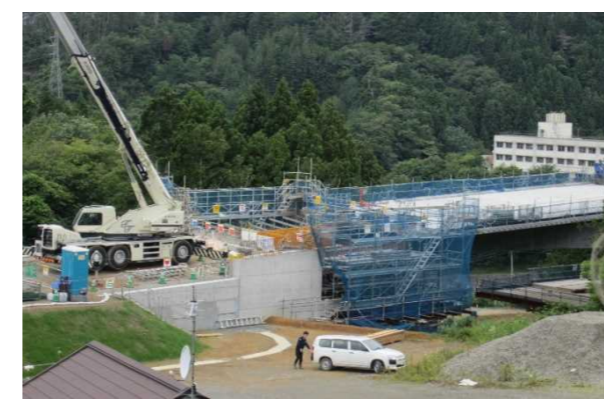
▲No285から終点側を望む [大峠山橋(仮)]