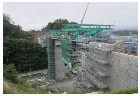
▲No271から終点側を望む [鹿折橋(仮)]