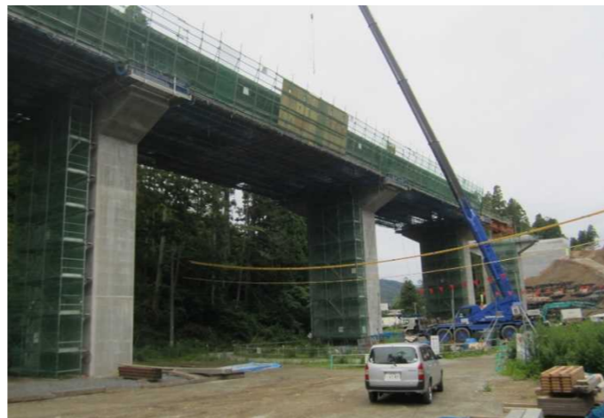
▲No.228から終点側を望む [浪板大橋(仮)]