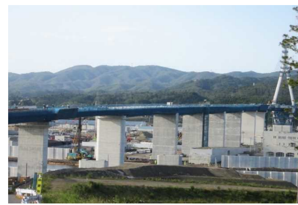
▲No.115付近から終点側を望む 〔(仮)気仙沼湾横断橋 P4～P11〕