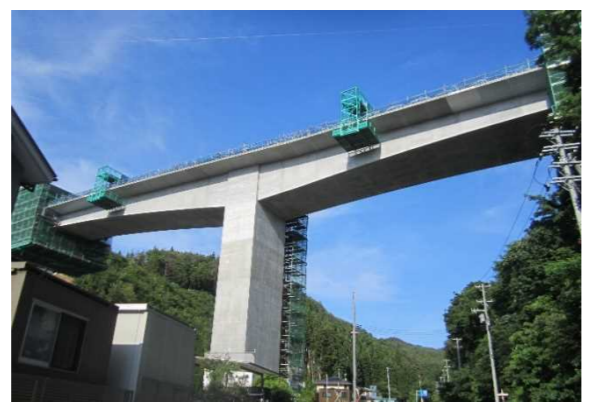
▲No271から終点側を望む [鹿折橋(仮)]