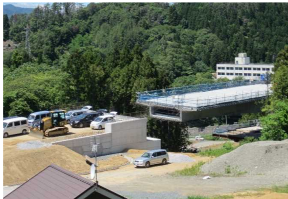
▲No285から終点側を望む [大峠山橋(仮)]