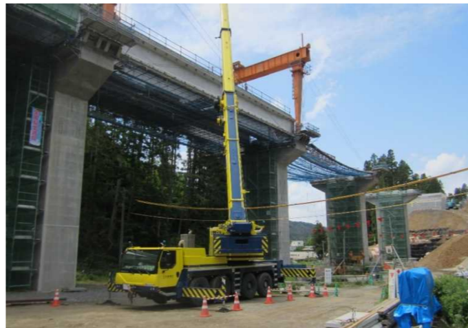
▲No.228から終点側を望む [浪板大橋(仮)]