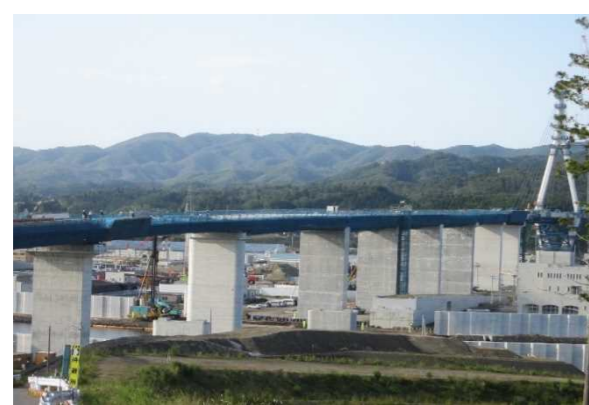
▲No.90付近から終点側を望む 〔(仮)気仙沼湾横断橋 P4～P11〕