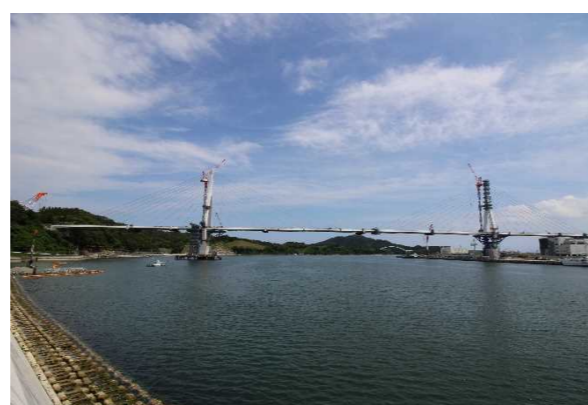
▲No.150付近から起点側を望む 〔(仮)気仙沼湾横断橋 P11～P12〕