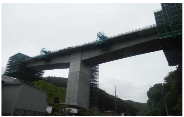
▲No271から終点側を望む [鹿折橋(仮)]