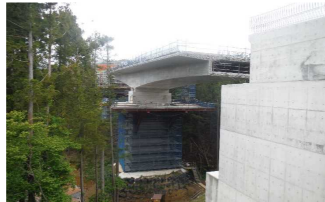
▲No285から終点側を望む [大峠山橋(仮)]