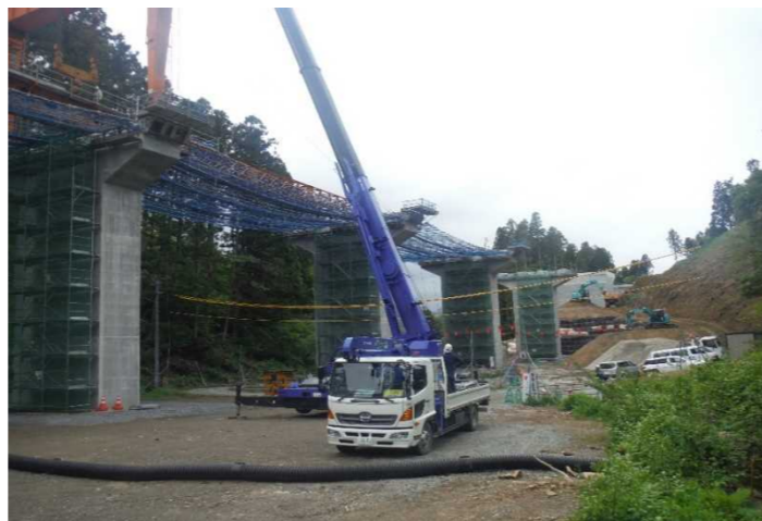
▲No.228から終点側を望む [浪板大橋(仮)]