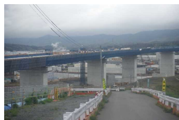
▲No.90付近から終点側を望む 〔(仮)気仙沼湾横断橋 P4～P12〕