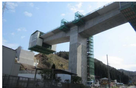
▲No271から終点側を望む [鹿折橋(仮)]