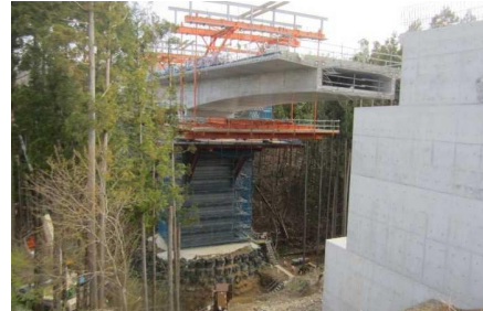
▲No285から終点側を望む [大峠山橋(仮)]