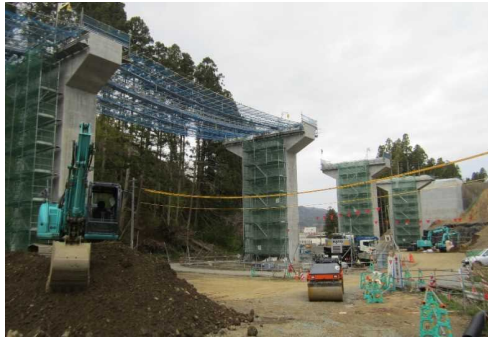
▲No.228から終点側を望む [浪板大橋(仮)]