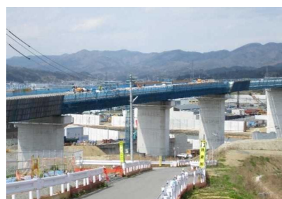
▲No.90付近から終点側を望む 〔(仮)気仙沼湾横断橋 P4～P12〕