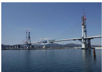
▲No.150付近から起点側を望む 〔(仮)気仙沼湾横断橋 P11～P12〕