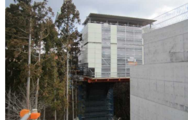
▲No285から終点側を望む [大峠山橋(仮)]