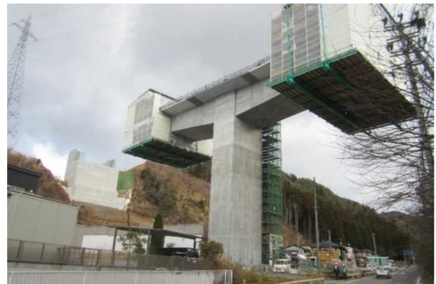
▲No271から終点側を望む [鹿折橋(仮)]