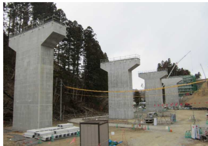
▲No.228から終点側を望む [浪板大橋(仮)]